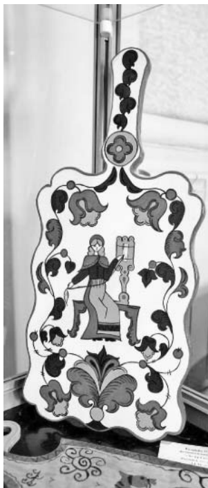
Расписная доска. Работа Ольги Егоровой.

В июне прошла областная выставка-конкурс «Молодые дарования в декоративно-прикладном искусстве», посвященная 75 летию Победы в Великой Отечественной войне.