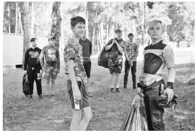
Уборка на стадионе «Центральный».

В МУП «Благоустройство» приступили к работе трудовые отряды школьников.