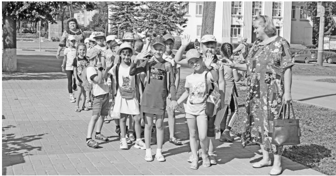
«Команда отдыхающих» из третьей школы идет на стадион.

Все меры безопасности, связанные с поведением, питанием и т. д. неукоснительно соблюдаются. Смена продлится 21 день. Большую часть дня ребята проводят на свежем воздухе.